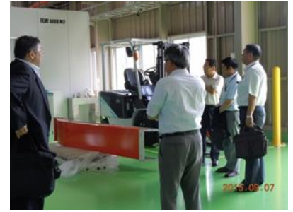
((有)コワタコーポレーション新工場視察・提案説明の様子)

平成 27 年 8 月 7 日 (金) に(株)日立製作所が「結の場 in 南相馬」に参加した南相馬企業を訪問し、電気料金削減の提案を具体的に聞くため実施致しました。(株)日立製作所からは、電機ソリューション本部、東北支社および日立パワーソリューションズの 3 事業所から 3 名の担当者が訪れました。